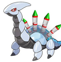
エバーフレッシュ