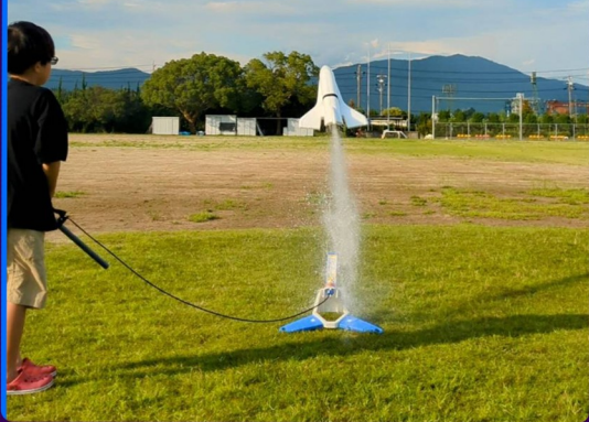
ロケット試し打ちにて最もよく飛んだ上位3名には(シャトル型ロケット)をプレゼントします

パーツを集めて自分だけの ペットボトルロケットを作ろう! 作ったロケットは持って帰れるよ