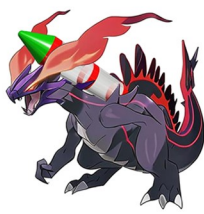
オペルケルガリア